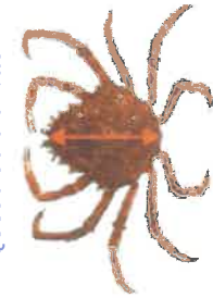
Araignée de mer