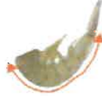
Queue de crevette