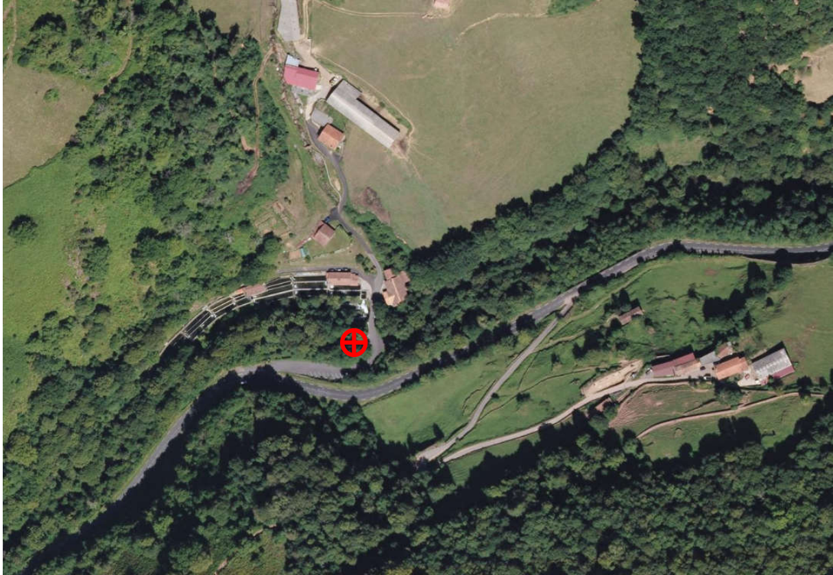
⊕ Positionnement forage en vue aérienne