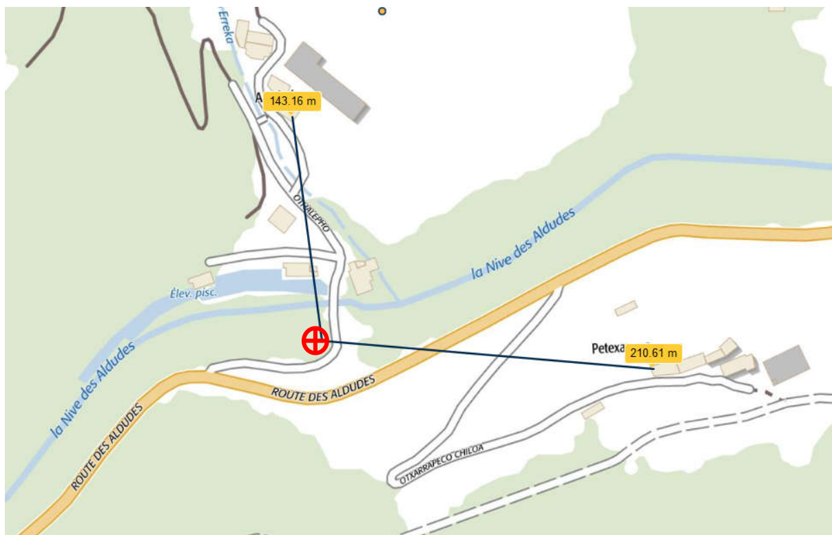
Distance vis-à-vis des bâtiments des fermes environnantes