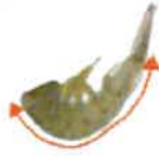
Queue de crevette