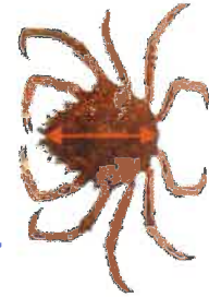
Araignée de mer