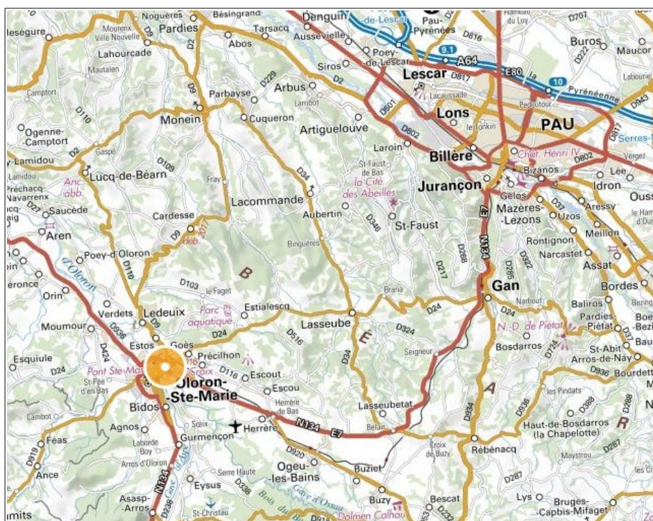
Localisation de la commune de Ogeu les Bains

La mise en compatibilité du PLU fait donc l'objet d'une évaluation environnementale. Conformément aux dispositions de l'article L. 300-6 du Code de l'urbanisme, le présent avis de l'Autorité environnementale porte sur les dispositions de cette mise en compatibilité.