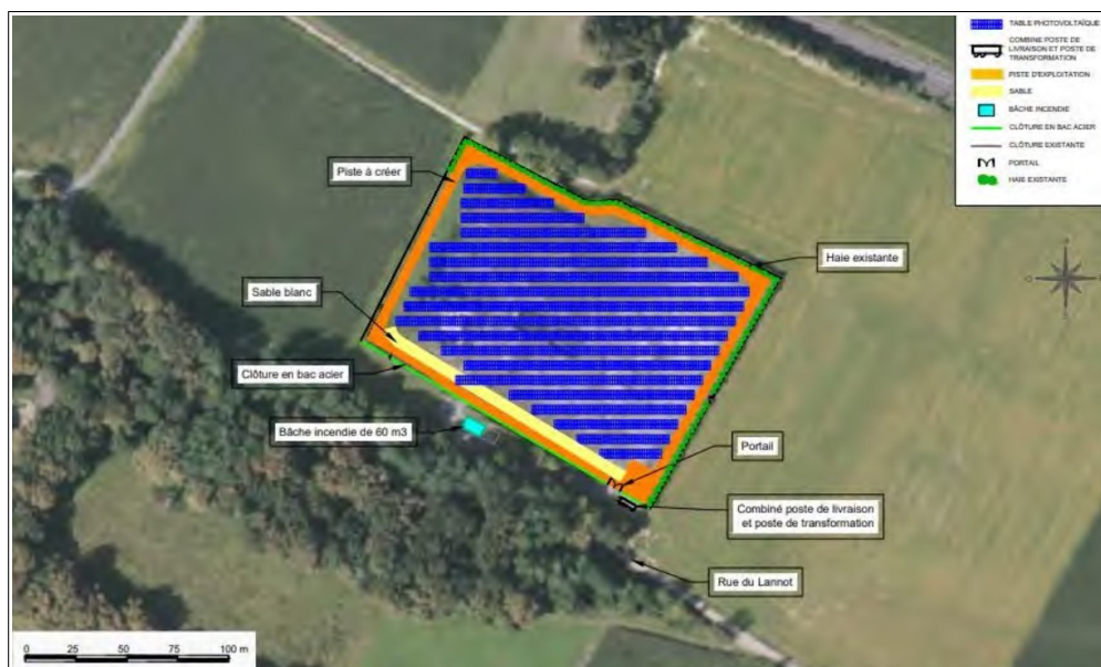
Plan masse du site Mazères 6 – extrait étude d'impact page 42