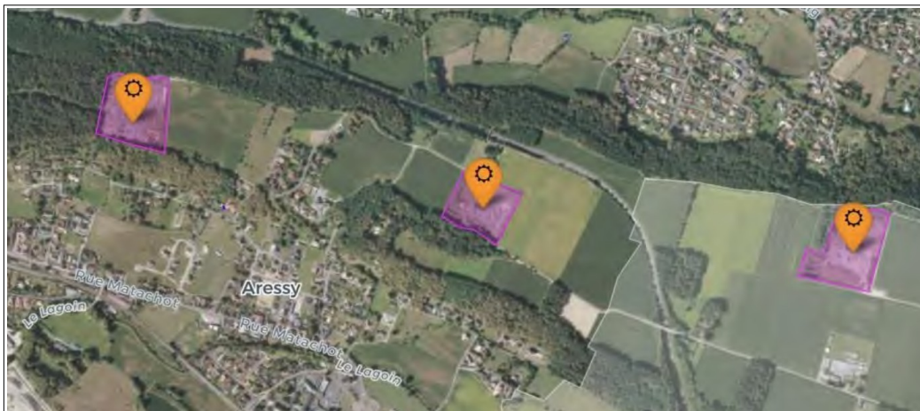
Vue aérienne du site – extrait étude d'impact page 14