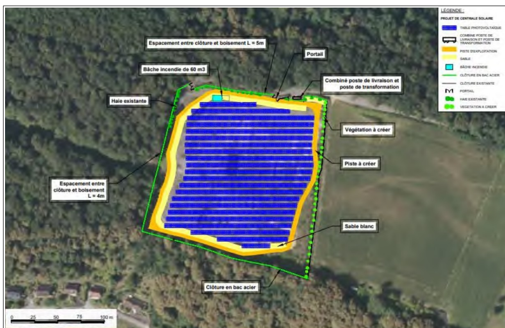
Plan masse du site Lanot 1-2 – extrait étude d'impact page 40