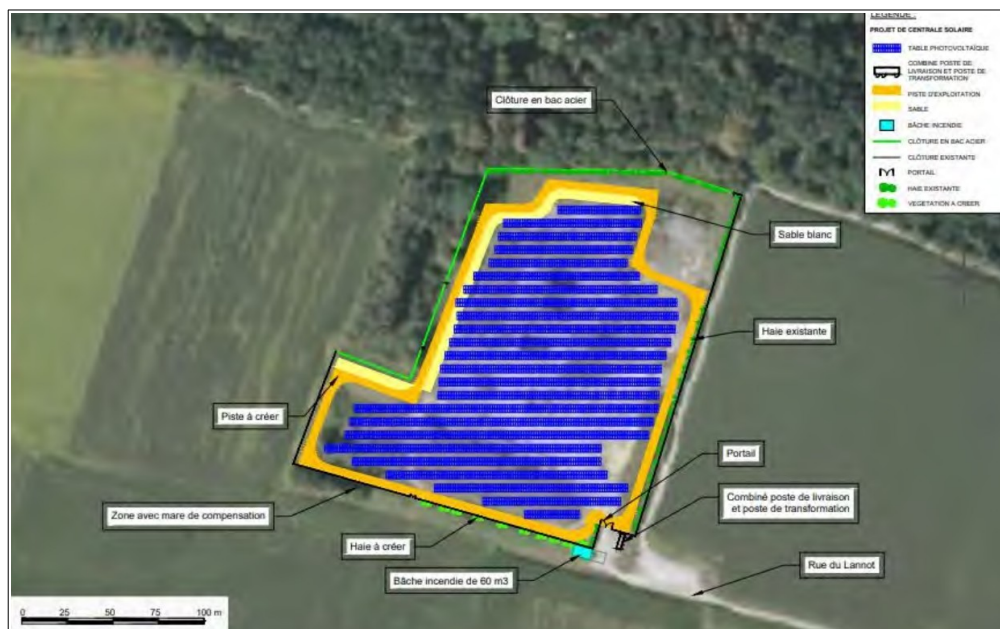
Plan masse du site Lanot 4-5 – extrait étude d'impact page 41

Le projet prévoit un raccordement électrique via des réseaux enterrés par piquetage sur une ligne existante à proximité du site (cf tracé en page 50 de l'étude d'impact).