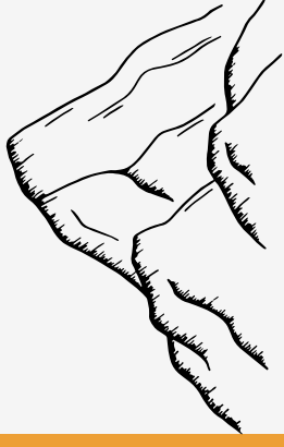
Circonscriptions de louveterie